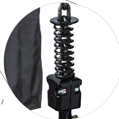
Hoogwaardige, duurzame ketting eindstop / High quality, durable chain end buffer