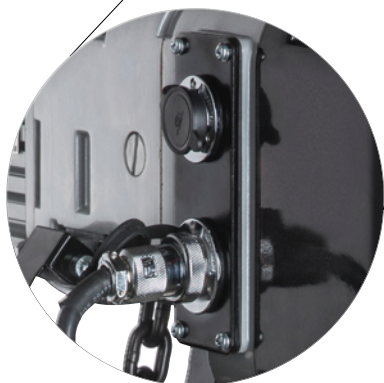
Eenvoudige plug&play-aansluitingen / Easy plug&play connections